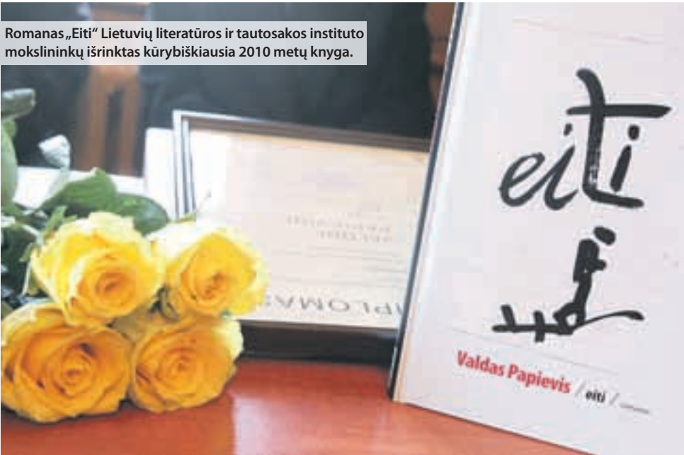
Romanas „Eiti“ Lietuvių literatūros ir tautosakos instituto mokslininkų išrinktas kūrybiškiausia 2010 metų knyga.

Prisimenu, kad kartą man taip suskaudo padą, jog vos galėjau pastatyti koją ant žemės. Gydytojai man negalėjo padėti, nežinojo, kas yra. Eiti tekdavo ypač lėtai, dedant koją po kojos. Tačiau eidamas pamačiau tai, ko iki tol matyti neteko, pro ką pralėkdavau daug negalvodamas – pamačiau žmonių veidus, jų mimikas, įsižiūrėjau į pastatus, šaligatvius, stogus... Pamačiau kažką tikro.