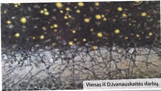
Vienas iš D.Ivanauskaitės darbų.

Vilniaus grafikos meno centro galerijoje „Kairė – dešinė“ rytoj bus pristatytos net dvi naujos parodos.