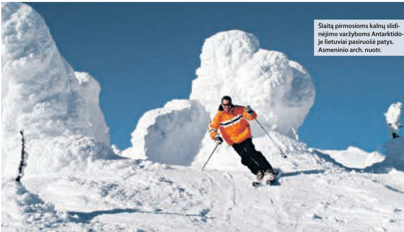
Šlaitą pirmosioms kalnų slidinėjimo varžyboms Antarktidoje lietuviai pasiruošė patys.

Pasaulio lietuvių kalnų slidinėjimo mėgėjų asociacija (PLKSMA) pranešė gerą žinią – ekspediciją „Antarktida 2011“ galima laikyti pavykusia, mat pirmą kartą Antarktidos istorijoje čia pavyko surengti kalnų slidinėjimo varžybas.