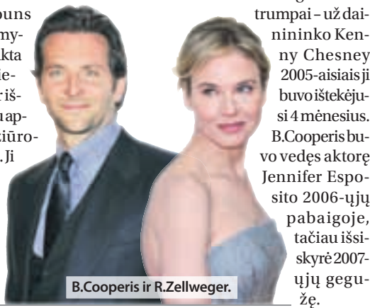
B.Cooperis ir R.Zellweger.

Abu aktoriai anksčiau buvo sukūrę šeimas. R.Zellweger žmonos statusu mėgavosi itin trumpai – už dainininko Ken-ny Chesney 2005-aisiais ji buvo ištekejusi 4 mėnesius. B.Cooperis buvo vedęs aktorę Jennifer Espo-sito 2006-ųjų pabaigoje, tačiau išsiskyrė 2007-ųjų gegužę.