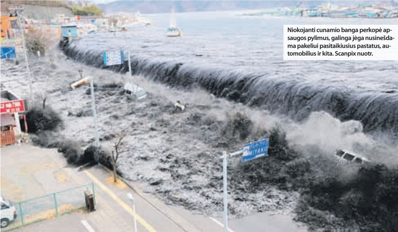
Niokojanti cunamio banga perkopė apsaugos pylimus, galinga jėga nusinešdama pakeliui pasitaikiusius pastatus, automobilius ir kita.

čius nuolat auga. Vakar buvo patvirtinta beveik 1,6 tūkst. žmonių žūtis, tačiau baiminamasi, kad aukų skaičius gali viršyti 12 tūkst. ar net daugiau. Vien Mijagio provincijoje galėjo žūti daugiau kaip 10 tūkst. žmonių.