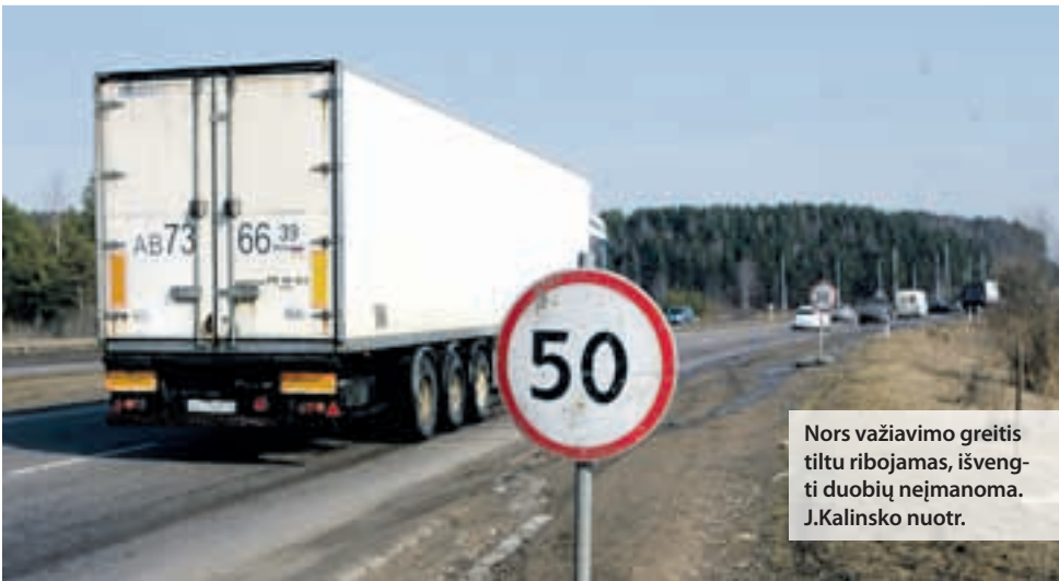
Nors važiavimo greitis tiltu ribojamas, išvengti duobių neįmanoma.

bai baisi danga, o paties tilto būklė patenkinama, tiltas tikrai neturėtų griūti“, – tikino A.Steponavičius.