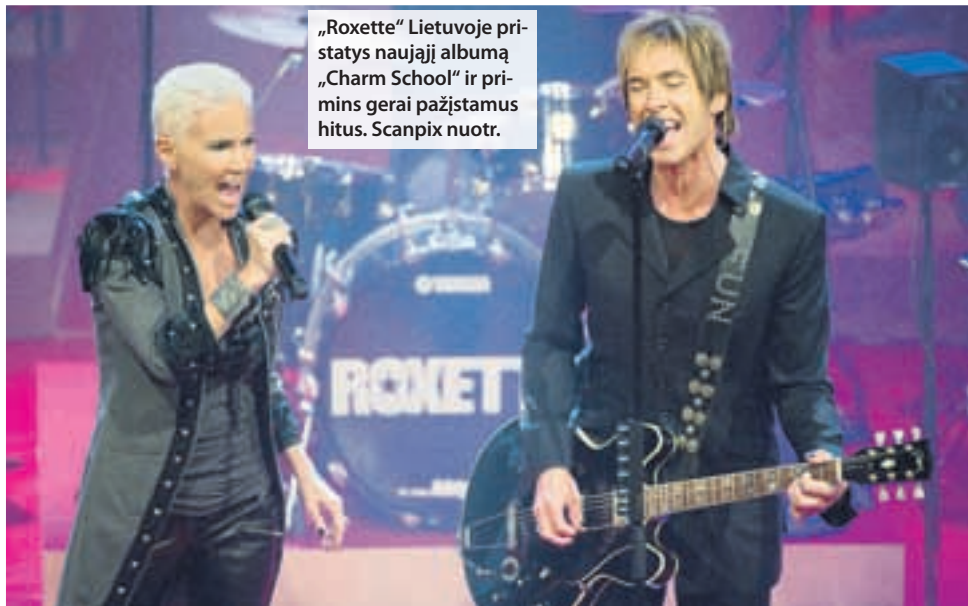
„Roxette“ Lietuvoje pristatys naująjį albumą „Charm School“ ir primins gerai pažįstamus hitus.

Nei kelintą valandą atvyks, nei kur apsistos šiandien Vilniaus „Siemens“ arenoje koncertuojanti garsi švedų grupė „Roxette“, vakar koncerto organizatoriai neišdavė.