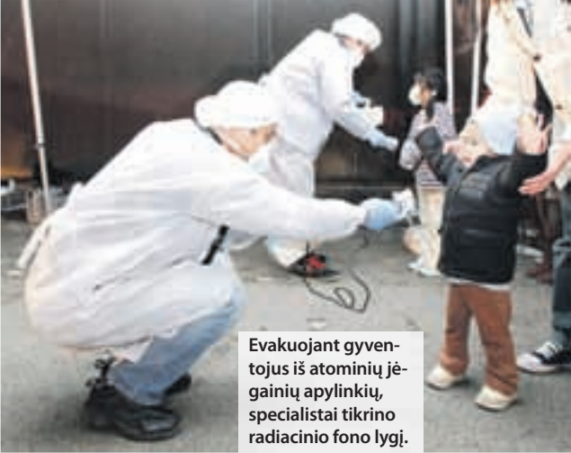
Evakuojant gyventojus iš atominės jėgainių apylinkių, specialistai tikrino radiacinio fono lygį.